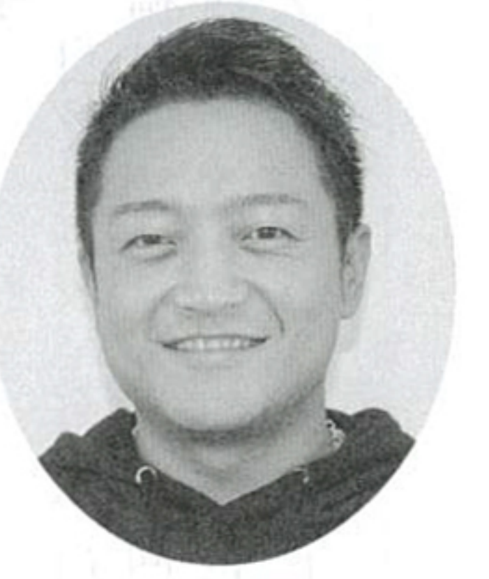
(株)漢方生薬研究所