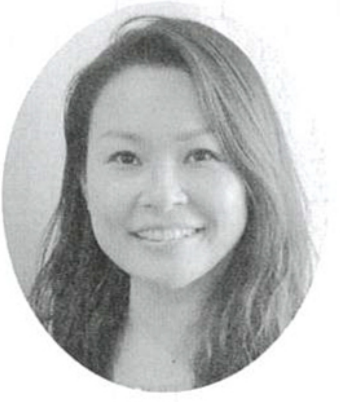
カスタマーグロース(同)

DATA [所在地] 〒810-0041 福岡市中央区大名2-6-11 Fukuoka Growth Next [設立] 2017年8月3日 [事業内容] 電動キックボードシェアリングサービスの運営 [TEL] 092-717-3384